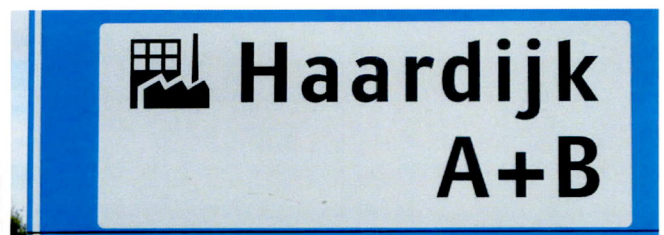
Wegwijzer met gashouder en sheddaken en een niet rokende schoorsteen.

(Wij als stichting Fabrieksschoorstenen willen deze symbolen graag zou houden, vandaar niet verder vertellen, en geen slapende wegwijzers wakker maken !)