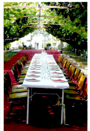
Dineren in de kas.