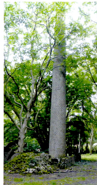
Schoorsteen verborgen in de bossen.

Het bestuur was op werkbezoek in Brabant, daarbij troffen we een kleine schoorsteen aan helemaal verscholen in een bosachtig terrein. De schoorsteen hoorde van oorsprong bij een particuliere kas van de Burgemeester van Aarle-Rixtel, het is wel de bedoeling dat de schoorsteen wordt ingepast in nieuwe plannen.