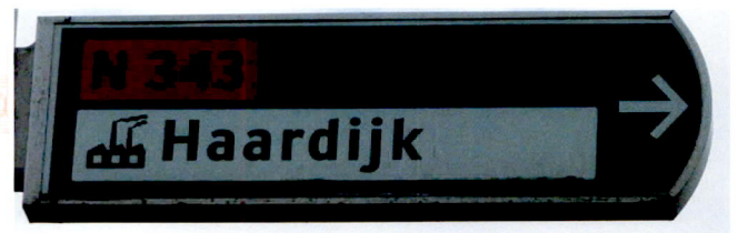
Wegwijzer met rokende schoorstenen en sheddaken.