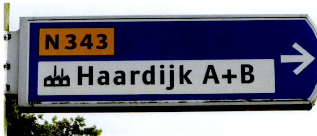
Wegwijzer met sheddaken en niet rokende schoorstenen.

Hospitaal dus ziekenhuis. Iedereen kent dit symbool. Maar we worden ook naar industrieterreinen verwezen, daarbij is er geen een duidend algemeen vignet. Voor onderzoek ten behoeve van het schoorsteenboek viel het mij op dat daarbij als symbool altijd een schoorsteen en een fabrieksgebouw met sheddaken gebruikt wordt. Welke fabriek heeft er nu nog een schoorsteen? Laat staan een rokende schoorsteen. Ziet u bij een spoorwegovergang nog het oude waarschuwingsbord met een stoomlocomotief afgebeeld ?, neen, deze is vervangen door het treintype "koploper" met de hoge bestuurderscabine.