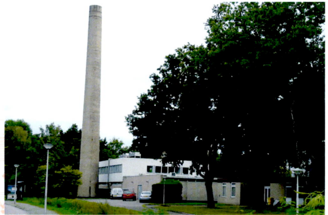
Amersfoort de schoorsteen bij het voormalige Elisabeth ziekenhuis.