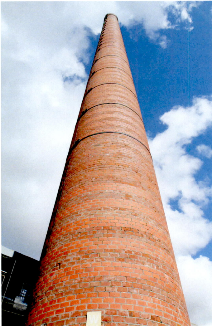
Stadskanaal, schoorsteen met “speklagen” in het metselwerk.

In Stadkanaal wordt de voormalige Philips fabriek gesloopt, de schoorsteen wordt met sloop bedreigd. We hebben deze schoorsteen goed bekeken en hebben een merkwaardige versieringsvorm ontdekt. De stenen hebben om de drie lagen metselwerk een iets afwijkende kleur met mogelijk ook licht van kleur afwijkend voegwerk, waardoor het net lijkt of de schoorsteen uit verschillende “speklagen” bestaat.